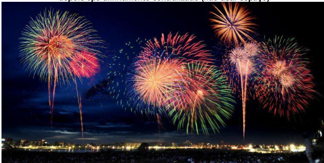
Figura 1 – (usar – e não : ) fonte 10 negrito – espaçamento simples entre linhas/ antes e depois 0pt/ alinhamento centralizado (não usar espaço)

(atenção: na imagem não coloque a opção de ancoragem de imagem – use sempre o layout “Alinhado com o texto” nunca opte por atrás, na frente ou qualquer outro tipo) – outra